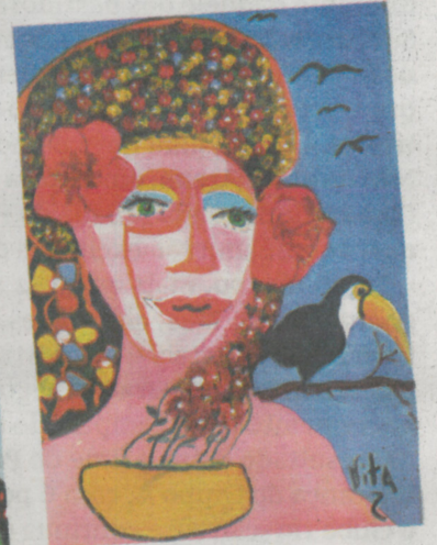
Em sentido horário, de cima para baixo: "Dália e o Cardeal", "Hibisco e o Tucano" e "O Circo"