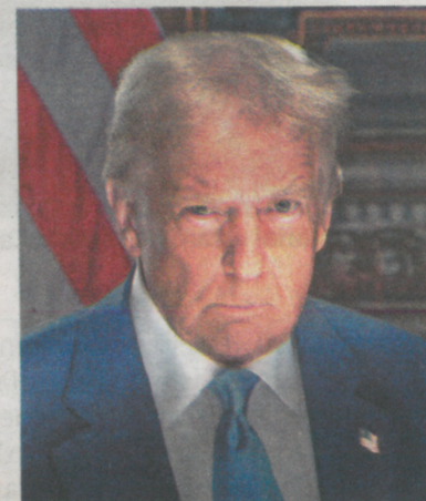
Trump será o 47º presidente