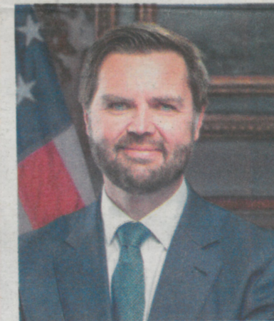
JD Vance, o vice-presidente

Os primeiros-ministros da Itália, Giorgia Meloni, e da Hungria, Viktor Orbán, foram convidados. Outras personalidades anunciaram presença: os franceses Marion Maréchal e Eric Zemmour, o britânico Nigel Farage e um dos líderes do partido alemão AfD, Tino Chrupalla.